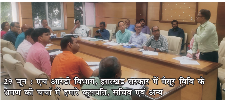
29 जून : एच आरडी विभाग, झारखंड सरकार में मैसूर विवि के भ्रमण की चर्चा में हमारे कुलपति, सचिव एवं अन्य